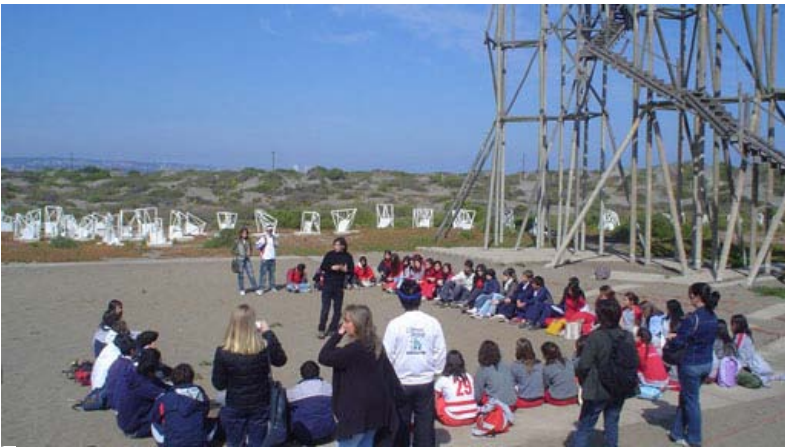
Escolares participan en Jornada de Artes Visuales 2007-10-01

Alrededor de 150 alumnos de la Facultad de Arquitectura de la Universidad Nacional de Rosario visitaron nuestra Escuela este jueves 27 de septiembre, en el marco de un viaje de estudio que uno de sus talleres realiza, todos los años desde el 2000, a nuestra casa.