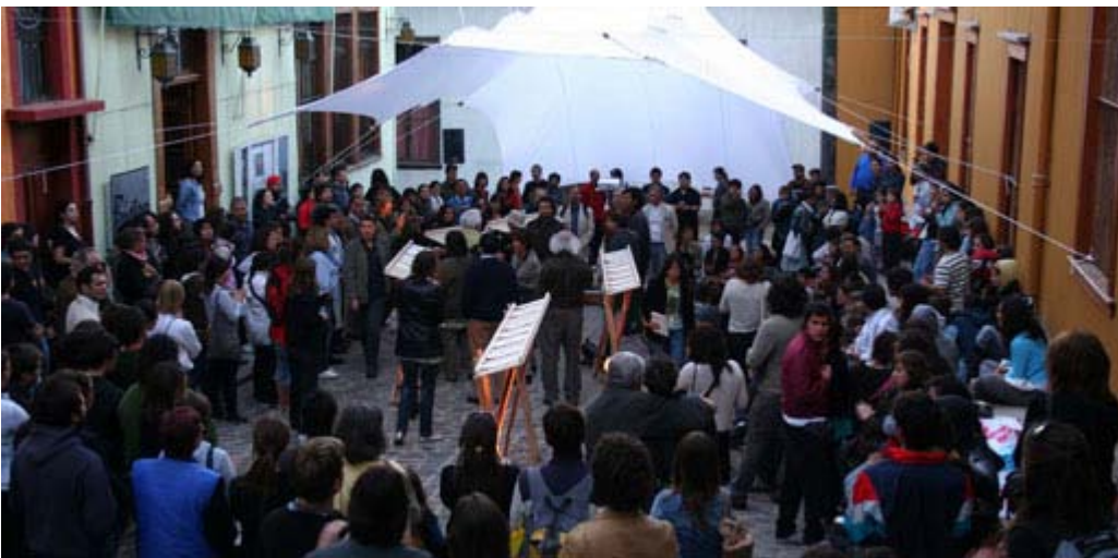
Con diversos actos termina año académico en e.[ad] 2007-12-14

Nuestra Escuela finaliza su año académico con los Exámenes de los Talleres y un Acto público en Valparaíso, en el cual se exhibirán los trabajos audiovisuales sobre las Travesías.