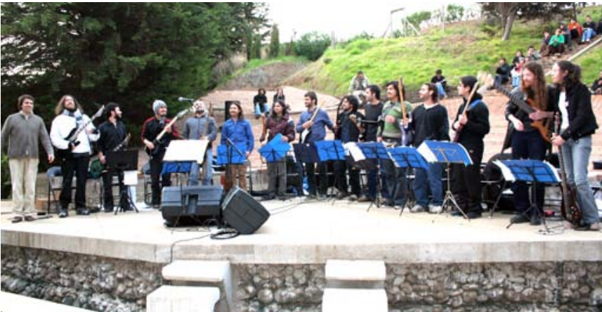
Día de San Francisco en la Ciudad Abierta 2007-10-05

En el marco del Día Abierto, este viernes más de 100 estudiantes de enseñanza media visitaron nuestra Escuela, como primer acercamiento a las aulas de la PUCV.