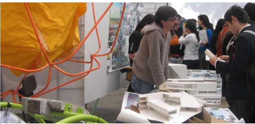
e.[ad] participa en Expo Admisión PUCV

El pasado jueves, un grupo de 80 estudiantes pertenecientes a los principales colegios ingleses de Viña del Mar, Valparaíso, Santiago y Concepción se reunió en Ciudad Abierta para conocer los oficios de Arquitectura y Diseño.