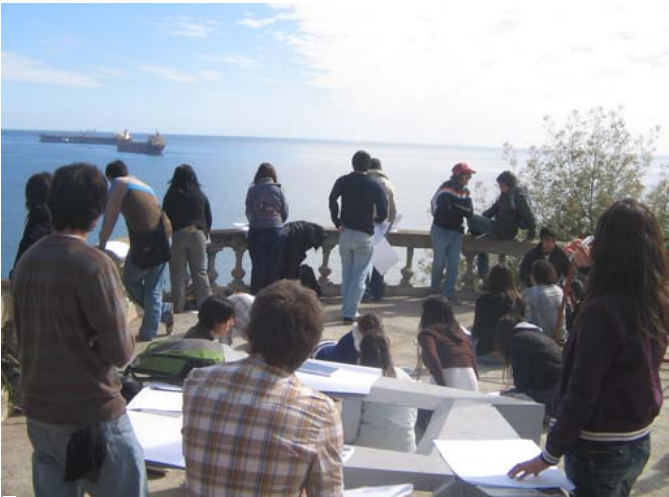
Escolares viven jornada como universitarios 2007-08-27

En el marco del Día Abierto, este viernes más de 100 estudiantes de enseñanza media visitaron nuestra Escuela, como primer acercamiento a las aulas de la PUCV.