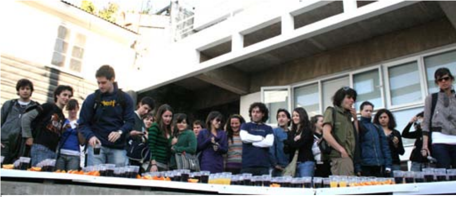
Estudiantes argentinos arriban a e.[ad] 2007-09-28

Alrededor de 150 alumnos de la Facultad de Arquitectura de la Universidad Nacional de Rosario visitaron nuestra Escuela este jueves 27 de septiembre, en el marco de un viaje de estudio que uno de sus talleres realiza, todos los años desde el 2000, a nuestra casa.